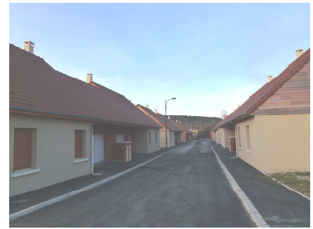
Les logements seniors sont désormais terminés et occupés pour la majorité d'entre eux. Nous souhaitons la bienvenue à leurs locataires