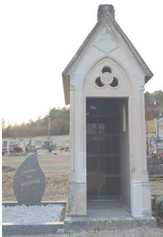
Un colombarium et un jardin des souvenirs ont été installés au cimetière de Ricey Haute Rive, où l'on pourra se recueillir .