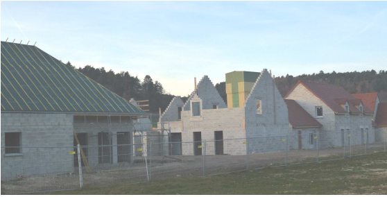
Évolution des travaux de la nouvelle gendarmerie.