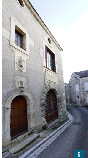
5. La chapelle Saint-Roch / 6. L'ancien tribunal