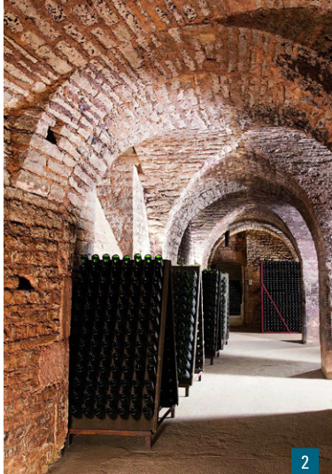
1b. L'orgue de l'église Saint-Pierre-ès-Liens / 2. Cave ancienne de maison de vigneron

L'extérieur de l'église est également remarquable. Un grand portail, à l'ouest, fut construit dans un style Renaissance classicant. Il est entouré de deux autres plus petits, qui ouvrent sur les collatéraux de l'église, l'un dans le même esprit, l'autre encore gothique. Ils font partie d'une façade qui est une des plus belles créations de la Renaissance champenoise.