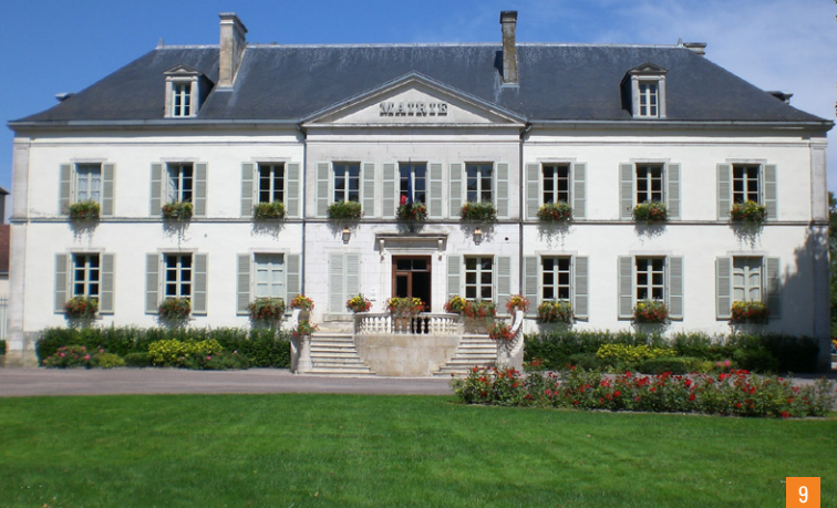
9. La façade sud du château Saint-Louis