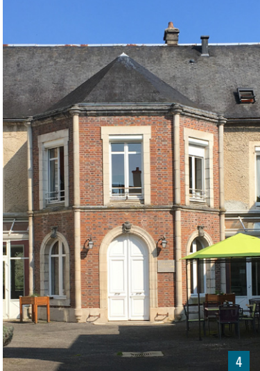
3. Maison ancienne / 4. L'ancien pavillon de chasse du château de Ricey-Bas