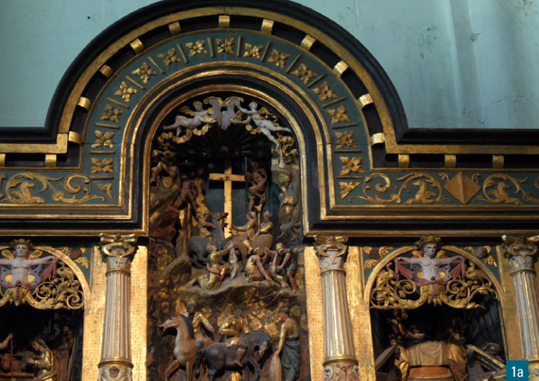
1a. L'un des 2 retables flamands de l'église Saint-Pierre-ès-Liens